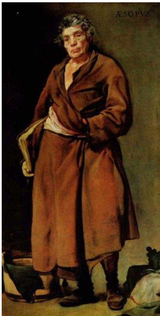
“La Grecia de los españoles” en el Esopo de Velázquez

evidente, “la Grecia de los españoles” resulta problemática en extremo. Con todo, puede que problemático sea aquello por lo que vale la pena preguntar. En este sentido se han planteado en el estudio las adaptaciones españolas de mitos griegos.